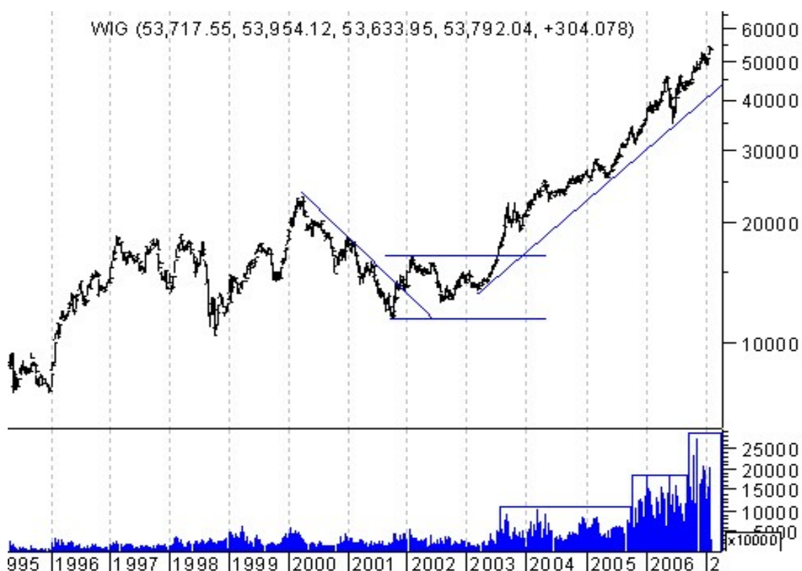
Wykres 3. Indeks WIG z zaznaczonym wolumenem

Obserwacja wolumenu nie może być traktowana jako samodzielny wskaźnik. Jest to raczej wskazówka lub element potwierdzający sygnały płynące z innych narzędzi.