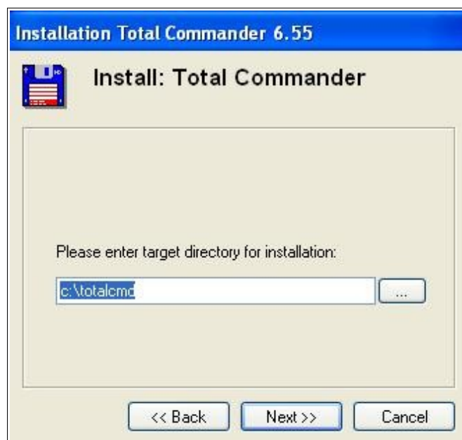
Rysunek 2. Ścieżka do instalacji programu.

W kolejnym kroku instalator zapyta nas gdzie chcemy zainstalować program. Domyślnie jest to c:\totalcmd. Po wybraniu ścieżki instalacji programu klikamy w następnych krokach na „Next”. Po zakończeniu instalacji program jest gotowy do użycia.