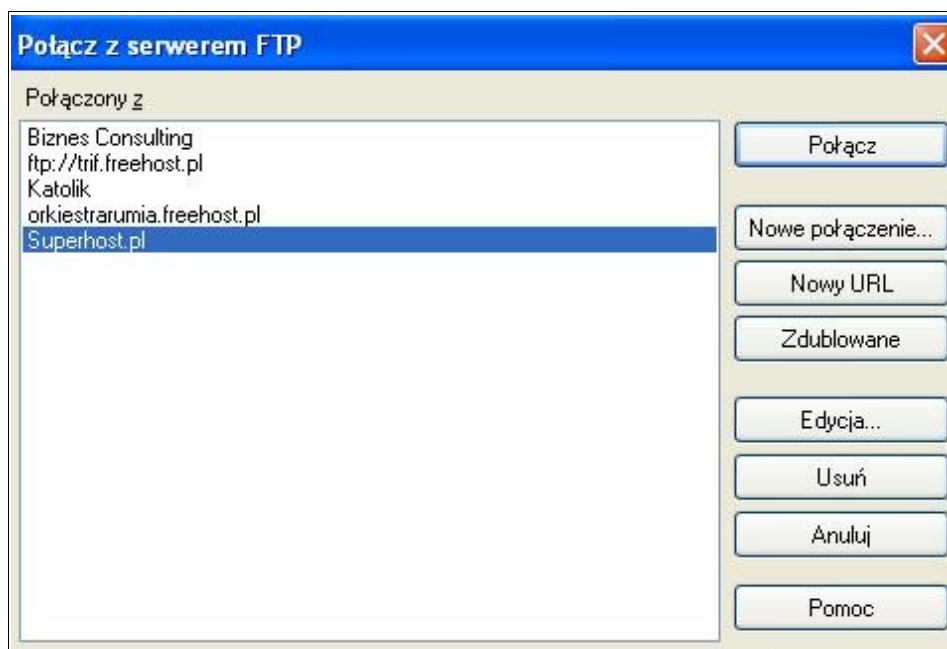
Rysunek 3. Konfiguracja połączenia.

Następnie wybieramy przycisk „Nowe połączenie”.