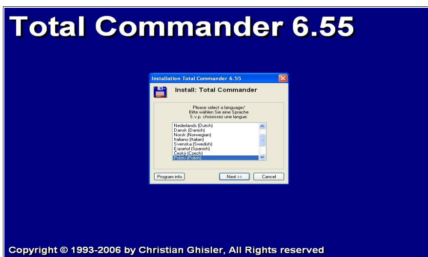
Rysunek 1. Okno powitalne instalatora Total Commander'a

Na początek ściągamy plik instalacyjny ze strony producenta, a następnie go uruchamiamy. Plik jest mały, tak więc nie powinno być problemów ze ściągnięciem go z Internetu (zajmuje około 1,6 MB).